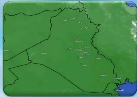
صورة الأقمار الصناعية صباح هذا اليوم