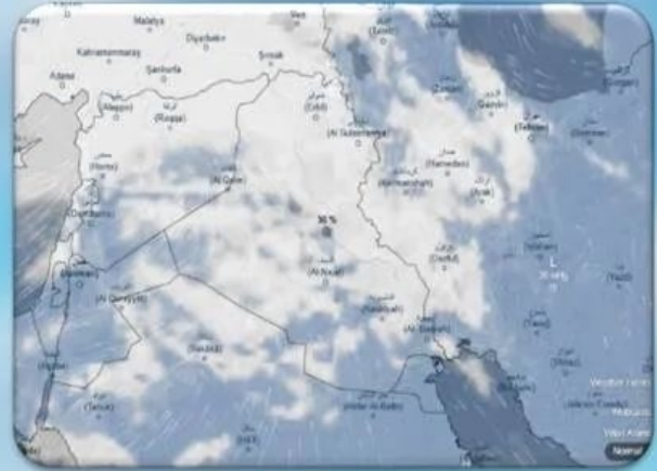
الغيوم المتوقعة يوم الاربعاء