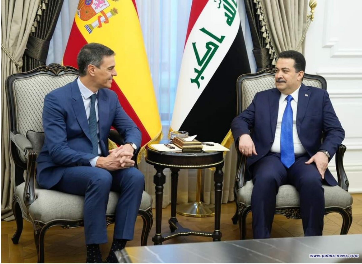
نخيل نيوز | العراق

بحث رئيس مجلس الوزراء العراقي محمد شياع السوداني، خلال استقبله نظيره رئيس الوزراء الإسباني بيدرو سانثيز، اليوم الخميس الثامن والعشرين من ديسمبر، مناقشة عدد من الملفات والمساعي لعقد الشراكات الاقتصادية بين مدريد وبغداد، كما اتفق الجانبان على البدء بجهود مشتركة من أجل عقد اتفاقية شراكة استراتيجية واستئناف عمل اللجنة المشتركة بدورتها (13) منتصف العام 2024.