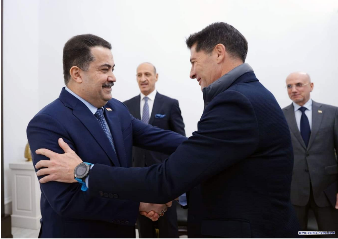
نخيل نيوز | العراق

أشاد رئيس مجلس الوزراء محمد شياع السوداني، اليوم الخميس الأول من شباط ، خلال استقباله وفد منتخبنا الوطني لكرة القدم، بحضور رئيس الاتحاد العراقي لكرة القدم عدنان درجال، ومدرّب المنتخب خيسوس كاساس، بالأداء الطيب للاعبين المنتخب في بطولة آسيا، الذي كان مصدر سعادة لجميع العراقيين، وإن كرة القدم هي لعبة فوز وخسارة. موجهاً شكره للاتحاد وللإكادير التدريبي.