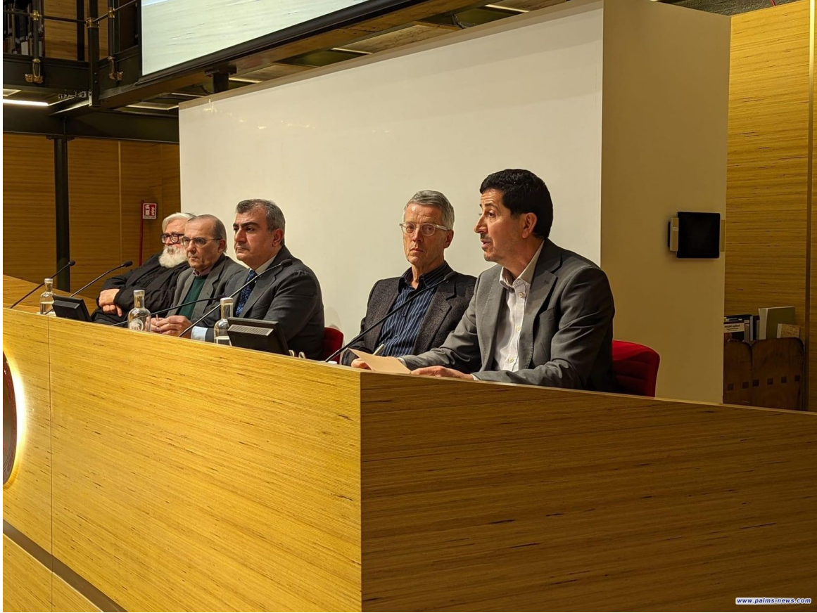
نخيل نيوز | خاص | إيطاليا