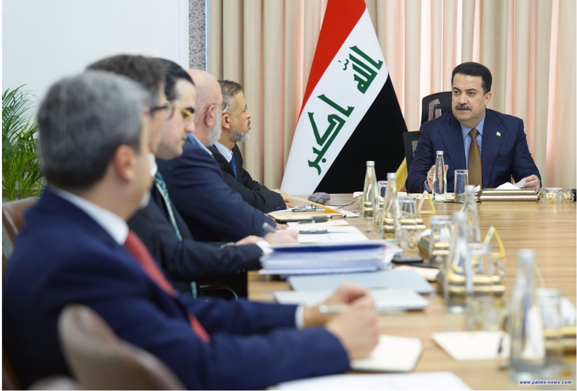
نخيل نيوز | العراق

ترأس رئيس مجلس الوزراء محمد شياع السوداني، اليوم الأحد الحادي عشر من شباط، اجتماعاً لمجلس إدارة صندوق العراق للتنمية، وهو الاجتماع الثاني خلال شهر، وذلك لمناقشة الفرص الاستثمارية الخاصة بتشييد المباني المدرسية في العاصمة بغداد وباقي المحافظات، وما يشكله هذا الملف من أهمية بالغة لدى الحكومة، وأولويات برنامجها التي تحتم الإسراع في تنفيذه.